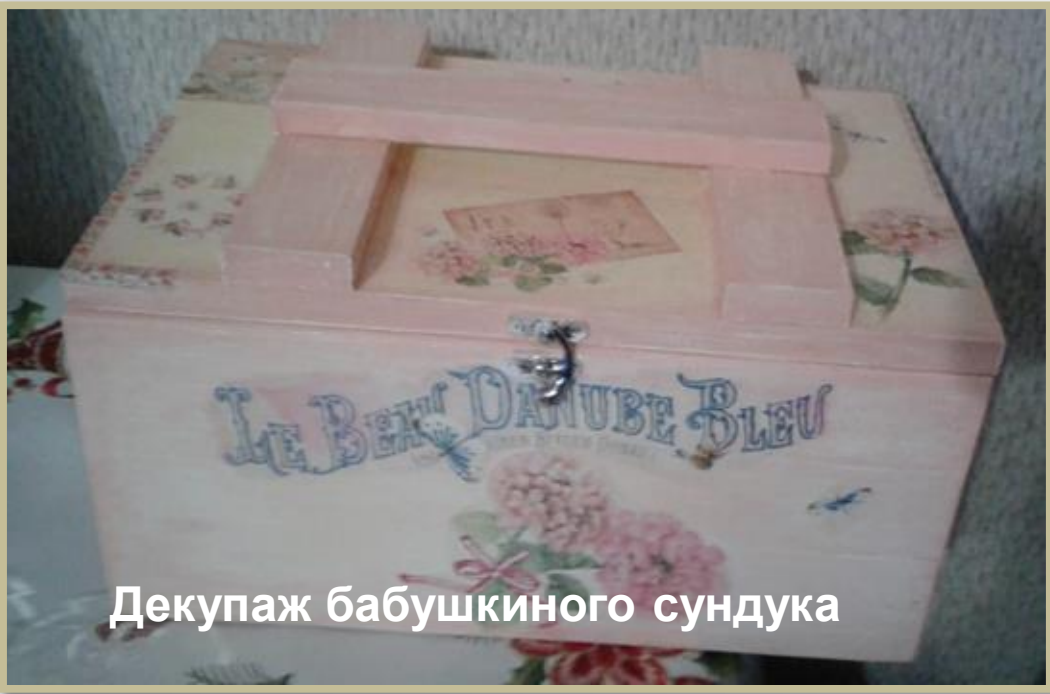
Декупаж бабушкиного сундука