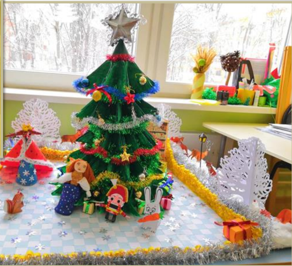
Новогодняя композиция «Щелкунчик и Мышиный король»